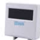
JEDNOLINIOWY WYŚWIETLACZ (WYPOSAŻENIE STANDARDOWE)