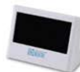
DWULINIOWY WYŚWIETLACZ (WYPOSAŻENIE STANDARDOWE)

DODATKOWE NAKŁADKI PODAJNIKA ZWIĘKSZAJĄCE POJEMNOŚĆ PODAJNIKA DO 600 SZT. BANKNOTÓW